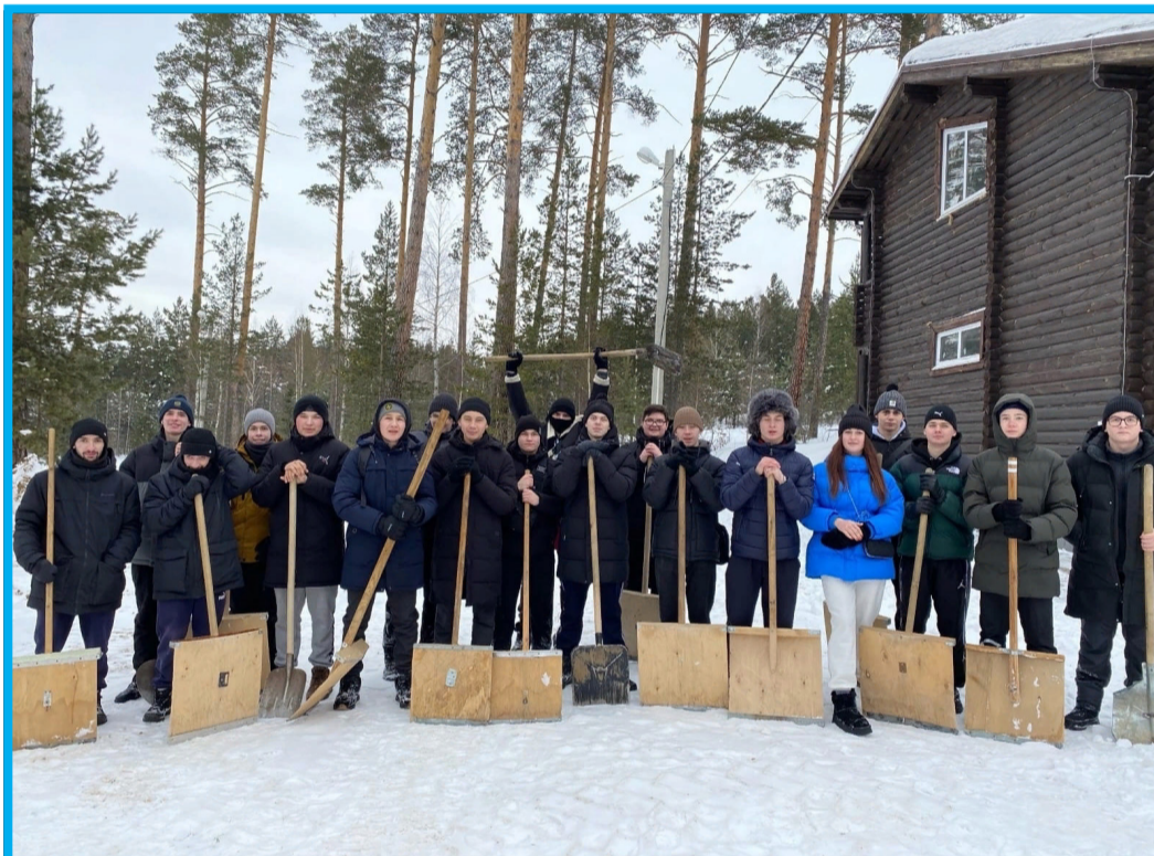
Активисты техникума начали готовить стадион задолго до стартов

Студенты техникума в очередной раз проявят себя в качестве волонтеров. Им не привыкать. На сей раз ребят призвали спортсмены: на соревнованиях по биатлону в помощи окружающим не будет равных нашим друзьям и однокурсникам. Работы предстоит много.